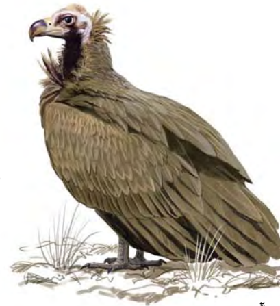
Dibuix: Toni Llobet

Les opcions per visitar l'espai són múltiples: hi ha nou itineraris marcats per fer a peu, d'entre 1 i 6 hores de durada. Es pot accedir amb vehicle 4x4 fins a les parts més altes de la reserva, per la pista del coll del Boix, o fins al coll d'Ares des del poble de l'Alzina d'Alinyà.