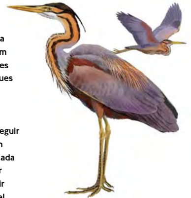
Dibux: Toni Llobet

La primavera, amb l'esclat de verdor al bosc i al canyissar, i la tardor, abans no caigui el fullam groguenc i vermellós dels arbres de ribera, són les millors èpoques per visitar l'espai, coincidint, a més, amb el pas dels ocells migradors. Partint del Sot del Fuster, és molt recomanable seguir pel camí que voreja el Segre en direcció a Tèrmens, una passejada de poc més de 2 km entre anar i tornar, que ens permetrà tenir diversos punts de vista sobre el riu i ens oferirà oportunitats per observar la fauna.